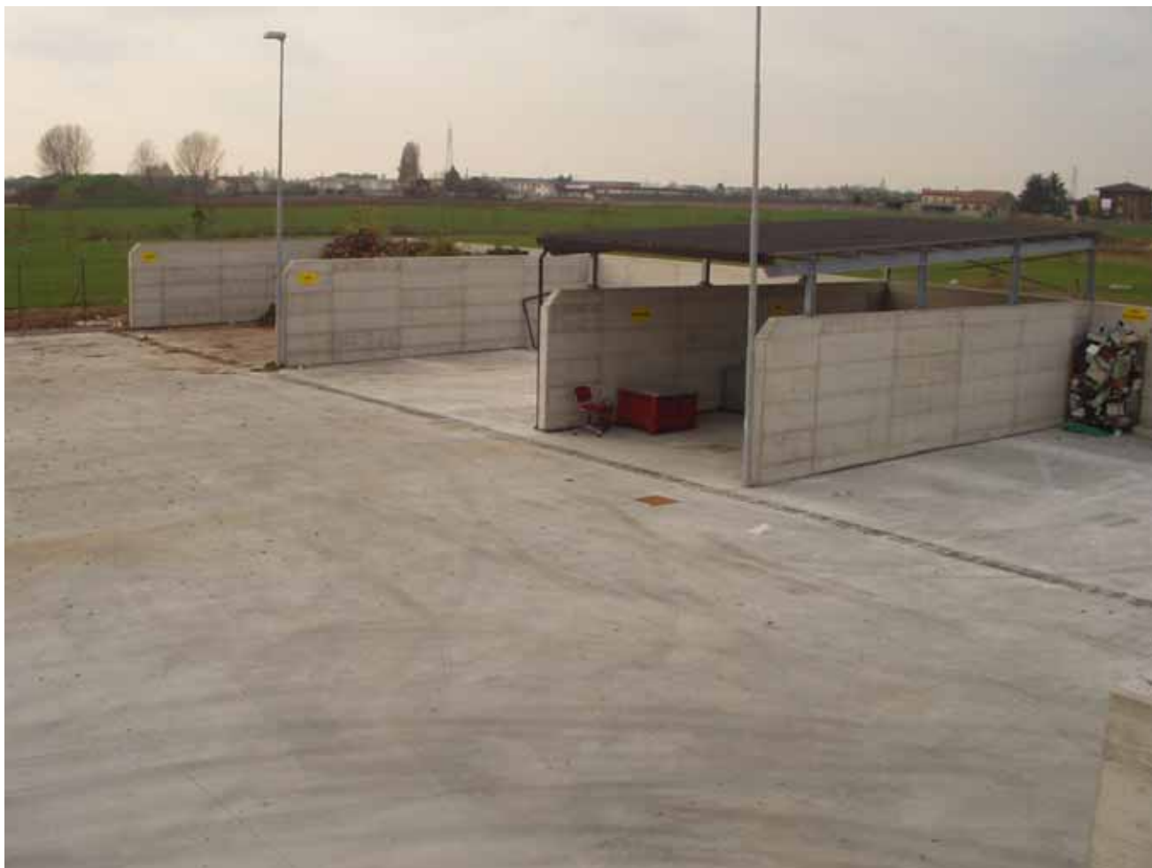
La piattaforma ecologica del Comune di Roverbella

A prescindere dalle necessarie dotazioni, in particolare le due piazzole ecologiche rappresentavano una necessità improcrastinabile